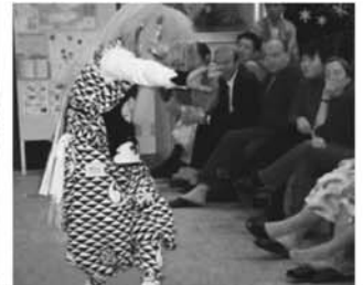
講師事前学習 ホテルで鬼太鼓見学