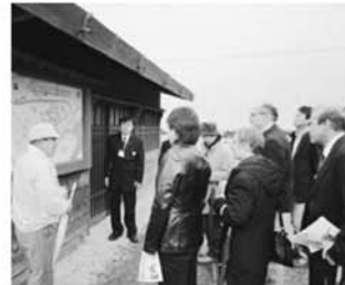
講師事前学習 宿根木にて ボランティアガイドの説明を受ける