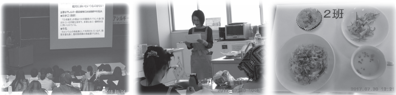
図2. 受講の様子（左から ベーシックプログラム講座、調理実習、米粉を用いたアレルギー対応食の実習作品）