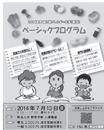
図3. 2014年度(第9期)ベーシックプログラムの案内チラシ

表5に本プログラム修了者の意見・感想を、学生と一般(社会人)に分けて抜粋した。ベーシックプログラムに参加した学生の内訳(学部・学科等)は、2014年度(第9期)～2019年度(第14期)の6年間の講座実績を概観すると、教職課程系が約40%、管理栄養士・栄養士養成課程系が約40%、幼児教育課程系が約15%、その他が約5%であった。資料代(テキスト等も含む)を支払っての1日集中講座であり、講義のスピードが速すぎるという意見等もみられたけれども、おおむね「受講して良かった」と、学生、一般(社会人)ともに満足度は高かった。